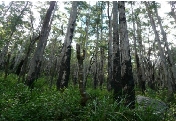
▲山火事から再生したウィルソンズ・プロモントリー国立公園のユーカリの森林地帯。国立公園では、この山火事も生態系の一部と見なし、国立公園の運営を行っています。