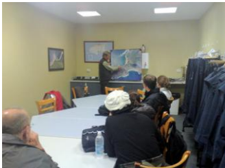
▲ペンギン保護プログラム