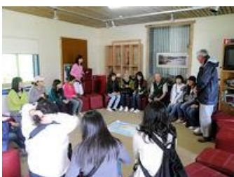
▲レンジャーとの質疑応答