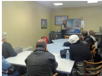
▲ペンギン保護プログラム