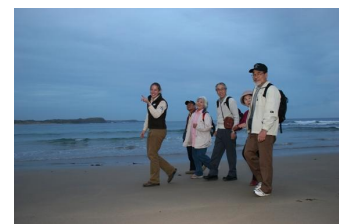
▲レンジャーとの質疑応答