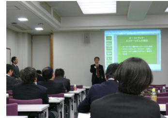
▲モナッシュ大学での座学