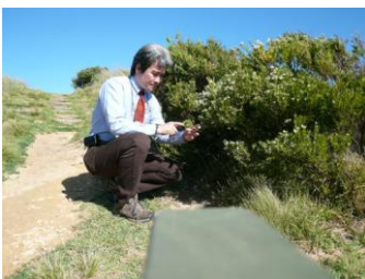
▲エコツアーも体験