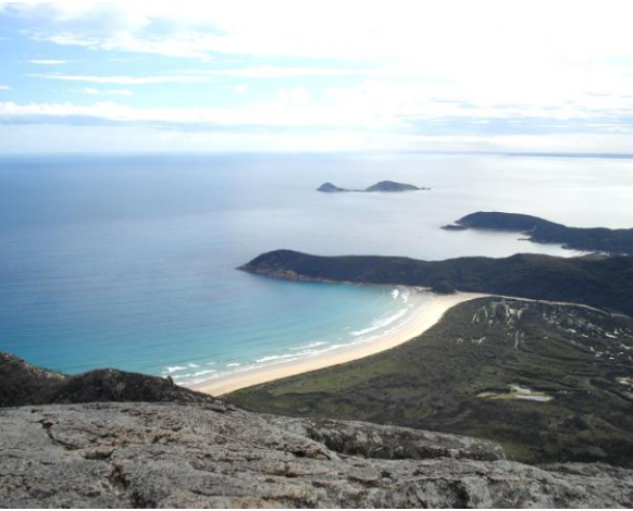
▲国立公園の最高峰、マウント・オベロンからの景色

Wilsons Promontory National Park (ウィルソンズ・プロモントリー国立公園)