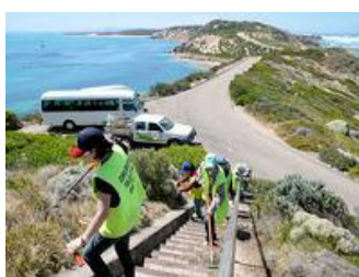
▲自然保護活動風景