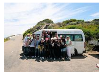
▲自然保護活動風景