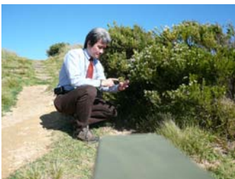
▲エコツアーも体験