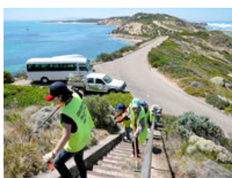
▲自然保護活動風景