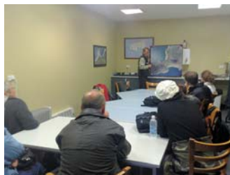
▲ペンギン保護プログラム