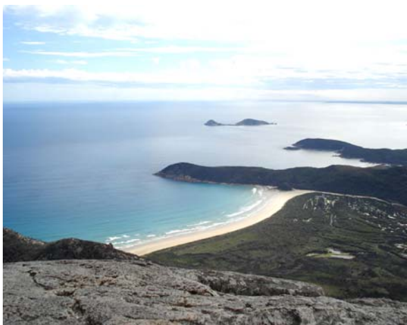
▲国立公園の最高峰、マウント・オベロンからの景色

Wilson's Promontory National Park (ウィルソンズ・プロモントリー国立公園)