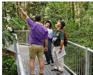
▲レンジャーとの質疑応答