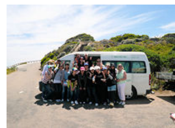
▲自然保護活動風景