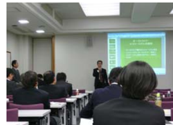
▲モナッシュ大学での座学