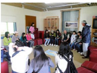
▲レンジャーとの質疑応答