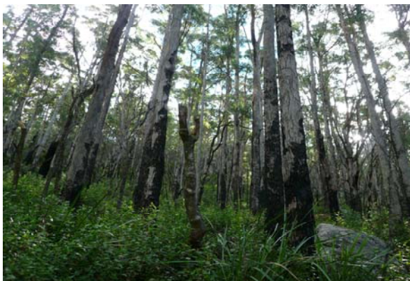
▲山火事から再生したウィルソンズ・プロモントリー国立公園のユーカリの森林地帯。国立公園では、この山火事も生態系の一部と見なし、国立公園の運営を行っています。