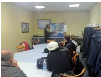
▲ペンギン保護プログラム