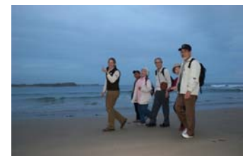
▲レンジャーとの質疑応答